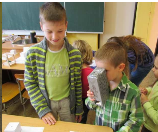
Kdo si hraje nezlobí